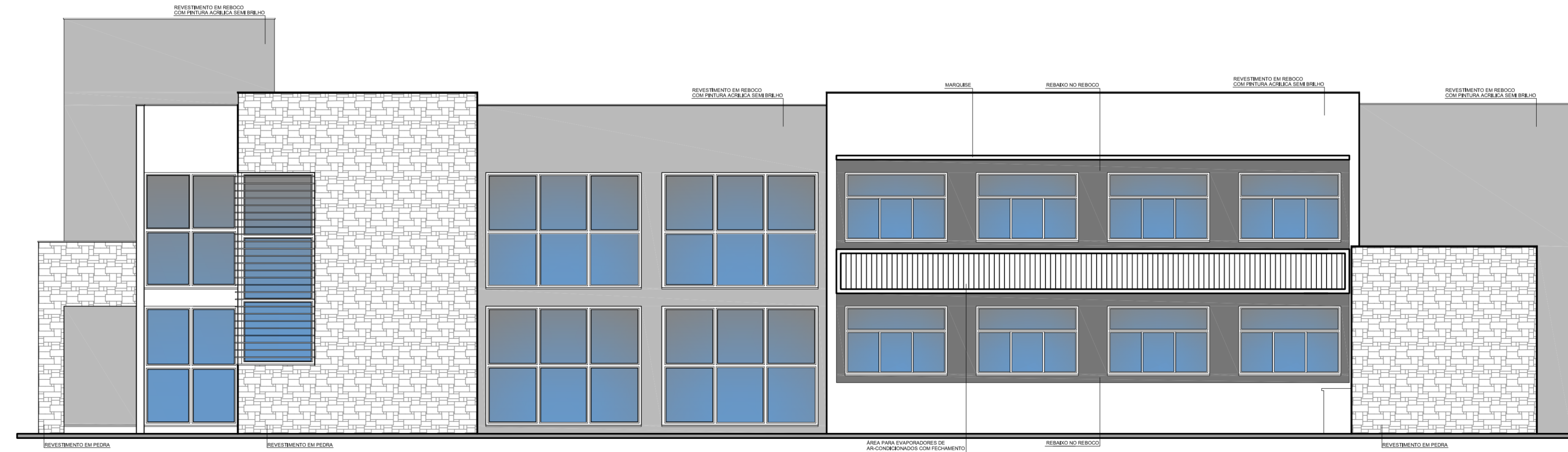
FACHADA NORTE ESCALA: 1/75